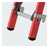
Sabots crantés antidérapants