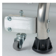
Roulettes amovibles en option en position travail réf. 02379813