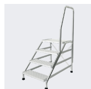
4 marches avec une rampe