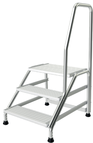
Modèle 3 marches

Ce marchepied avec rampe tout en aluminium est disponible de 3 à 5 marches pour atteindre jusqu'à 3 mètres hauteur travail. Ses marches striées antidérapantes d'une largeur de 560 x 200 mm et sa plate-forme de 560 x 400 mm font de lui un des marchepieds les plus confortables du marché. Disponible avec roues en option.