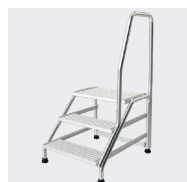
3 marches avec une rampe