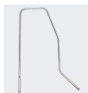
Modèle avec 2 rampes latérales et 1 kit roulettes

Option 1 rampe latérale : 02379814 - Option kit roulettes : 02379813