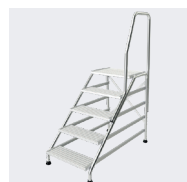
5 marches avec une rampe