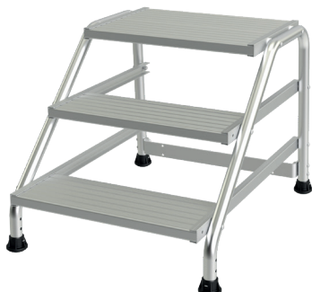
Modèle 3 marches

Ce marchepied tout en aluminium est disponible de 1 à 5 marches pour atteindre jusqu'à 3 mètres hauteur travail. Ses marches striées antidérapantes d'une largeur de 560 x 200 mm et sa plate-forme de 560 x 400 mm font de lui un des marchepieds les plus confortables du marché. Disponible avec roues en option.