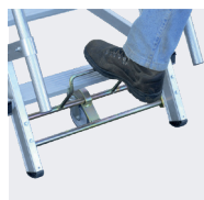
Système de verrouillage de la roue avant