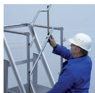
Portillon de sécurité