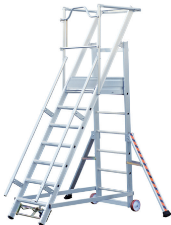
Modèle 7 marches

Cette plate-forme aluminium Tubesca-Comabi est disponible de 5 à 15 marches pour une hauteur de travail maximum à 5,26 mètres. Elle est idéale pour le rayonnage et le picking dans les ateliers. Sécurisée, elle dispose de stabilisateurs réglables, de rampes d'accès et d'un garde-corps rigide ainsi que d'une plate-forme avec plinthes intégrées. Pratique, elle dispose de roues de déplacement dont une est entièrement directionnelle. Elle est conforme au décret 2004-924 et à la norme EN 131-7. * Roulettes escamotables en série à partir du 7 marches (en option sur les 5 et 6 marches).