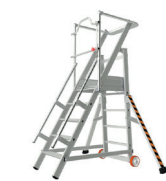
Modèle 5 marches avec stabilisateurs déployés pour une parfaite stabilité de la plate-forme.