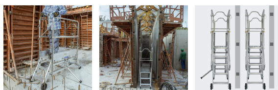
Les stabilisateurs escamotables permettent le travail le long des coffrages