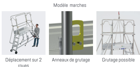
Déplacement sur 2 roues