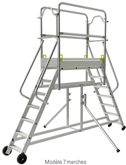
Modèle 7 marches

La passerelle banche en aluminium est l'outil indispensable de la construction. Grâce à son dimensionnement, ses différentes hauteurs jusqu'à 3,48 mètres, ses roues de déplacement et ses anneaux de grutage en série, elle sera s'intégrer parfaitement à l'intérieur de banches. Elle procurera aux professionnels du BTP / gros oeuvre un maximum de sécurité avec ses rampes et ses garde-corps rigides. Elle répond au décret 2004-924.