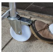
Montage rapide sans outil