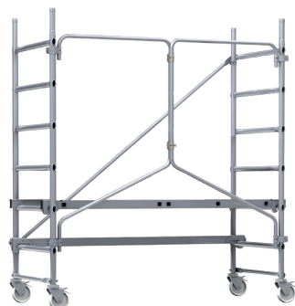
T-ONE 155 PRIMO référence 22401511